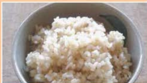
ポリフェノール玄米