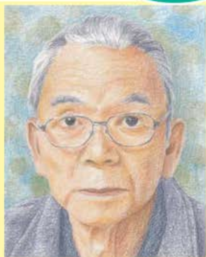
似顔絵作：松田 郁美