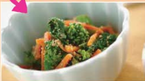
菜の花のごま和え (VC+βカロテン)