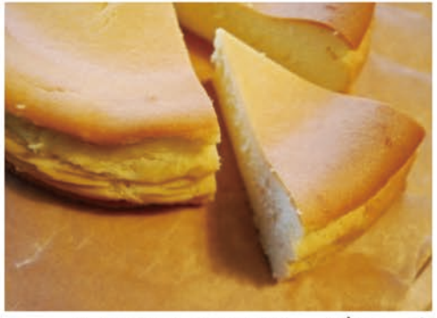
▲サツマイモのチーズケーキ