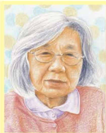
似顔絵作: 松田 郁美

結局高校は行けずに実家の牛飼いや乳しほりの手伝いをしてながら青春時代を過ごしていました。そのおかげもあつてか手や腕の力は付きましたが大きくなってしまった手が嫌だとの事です。又馬の世話もしており、裸馬鞍をしない馬に乗ることもでき、自慢だったそうです。