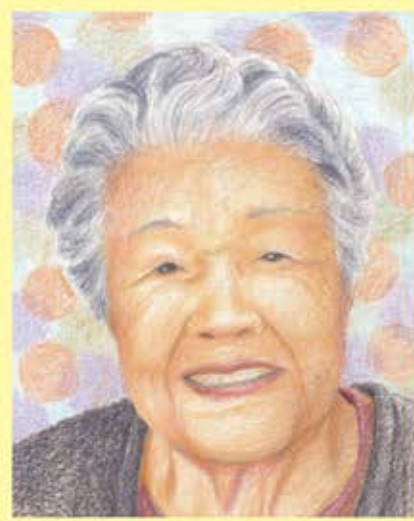
似顔絵作: 松田 郁美

その後父は42歳で亡くなり、当時農地はなく他人から借りており農業だけでは生活が苦しく、姉2人は10代で女中奉公に入り家計を助け母は40代なかばで再婚します、そして藤の沢へ引っ越ししました。 その後女子挺身隊に入り、電気修理工場に配属されすぐに本採用となり昇給し、ボーナスもできるようになりました。当時、初任給が3円で2円を母に渡し、50銭を貯金し50銭をお小遣いにしていました。 食糧難だった為日曜日になると無料バス(当時これで汽車にすぐ乗れた)を利用して田舎で買い出しをして、家族を食へさせていたそうです。