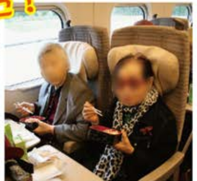
2泊3日の楽しい旅でした！