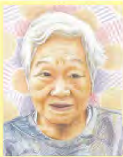
似顔絵作: 松田 郁美

息子様にお話しをお聞きしました。活発で気丈な人で働き者。真面目で負けず嫌いで一生懸命。弱音を吐くことはなかった。頭の回転も速く、口も達者だったそう(笑) H様のお母様とお寺によく通っていて、梵鐘を寄贈した思い出が印象に残っています。