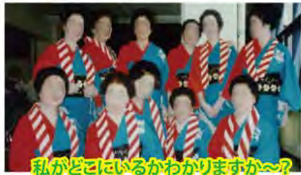
私がどこにいるかわかりますか〜?