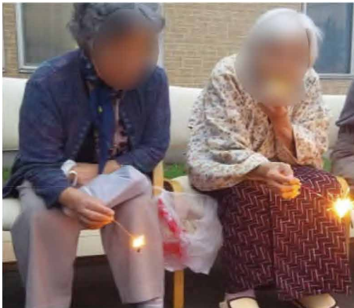
窓際で楽しめる渡〇様