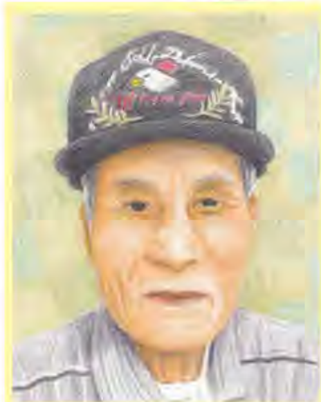
似顔絵作: 松田 郁美

Yさんは、昭和5年7月2日、利尻島杵形村蘭泊（くつかたむらんどまり）で男3人女4人の7人兄弟の長男として生まれました。父親は手漕ぎの小さな船に乗り、鯉や蛸、ホッケ漁で生計を立て、小学卒業後はYさんも船に乗り漁の手伝いをしていました。 18歳の時、遠洋漁業の船長をしていた叔父に頼まれ、樺太（現・サハリン）に漁に出掛けた所、突然エンジントラブルで運航不能となり、乗組員7人、3日間宗谷海峡を遭難した時は生きた心地がしなかったそうです。水難救助隊に救助され、もう漁師はこりごりだ！と思ったYさん。地元の仲間数名と共に旭川の警察予備隊（現・自衛隊）に応募し1期生として入隊します。その後札幌の真駒内駐屯地に転勤、55歳の定年まで勤務されました。 まだ雪の残る春の定山溪で、筍採りに夢中になり遭難された年配女性を探すため、2mはあろう笹の中を熊避けに一斗缶を叩きながら探したことや、石狩の海水浴場で溺れ流された成人男性を救助するために海や河口周辺を探索し救助したことなどをお話しして下さいました。 数々の人命救助に携わり、日々緊張感を持ち生活する反動か？ ススキノ5条6丁目辺りで飲食店を開いた同郷の友人に会いに行く・・・と言