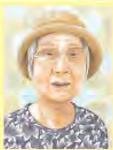
似顔絵作:松田 郁美

江別のご自宅に独居していたKさんですが、昨年、もし自分に何かあったら娘に迷惑を掛けるから、とご主人と同じ式番館に入居されました。入居当時はご主人との距離感が掴めず一日中そばで見守り介護していたせいで、Kさん自身もてんかんの発作で倒れてしまうこともありました。今ではご自分の時間も大切に、デイサービスにも通い、江別のご友人とも食事に出掛けたりと気分転換を図り、体調を見ながら無理せず生活されています。 穏やかで誰にでも優しく笑顔の素敵なKさん、高嶺三枝子さんの「湖畔の宿」が大好きだそうです。これからも夫婦仲良く元気に過ごして下さいね。