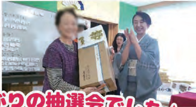
★大盛り上がりの抽選会でした★