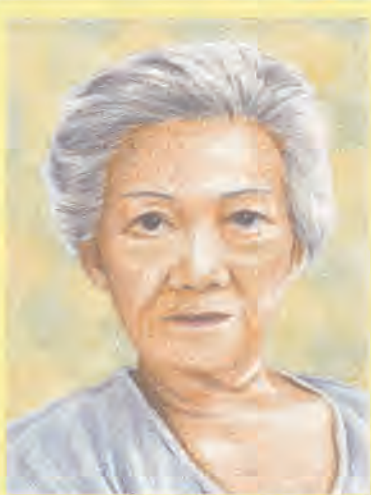
似顔絵作:松田 郁美

Gさんは昭和26年、函館市杉並町で5人兄妹の二女として生まれます。面倒見の良いGさんは小学生の頃、近所の美容室の娘さんの子守りをしてお小遣いをもらい、妹さん弟さんにお菓子を買ってあげたそうです。中学時代に「両親を亡くし、中学3年生の時妹さん弟さんと3人での施設での生活が始まります。