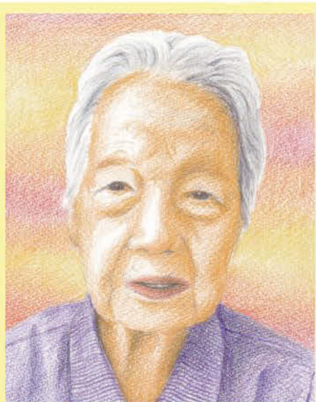
似顔絵作: 松田 郁美

Ｔさん大正8年5月15日生まれ現在99歳。静内町で生まれ、実家は昔から漁師で網元をされていたとの事です。「働き手が街へ出ていき稼業も存続が出来なくなっただ」と、おっしゃっていました。 御主人は10年以上前に他界され、長年日高町で一人暮らしをされていましたが、年齢に伴う筋力低下で独居が困難となり、平成23年7月から三女様の近くのCOCO東雁来弐番館に入居されました。 居室で得意とされている手芸をされ、犬やフクロウの置物、ピエロの飾り物などを作られ、のんびりと生活をされています。 作品は親しい入居者様