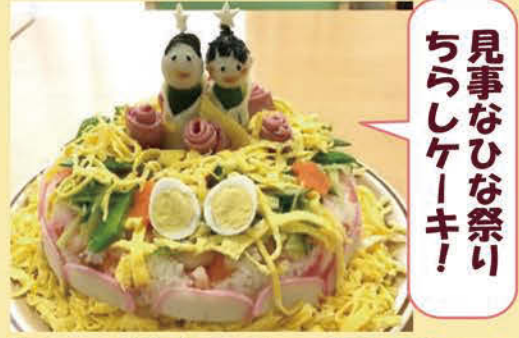
見事なひな祭りちらしケーキ!

本体では、春のお彼岸の日には「おはぎ」を作りました。ふっくらと炊きあがったご飯を潰し、小豆から作って餡子を丁寧につけて完成です。作っている内からつまみ食いをする方もいたそうです。温かいお茶をすすりながらおやつとして頂きました。皆さんの食べている時の「顔」...とってもいい笑顔でした。