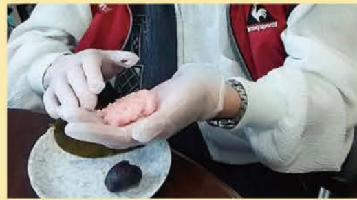
↑ 雛祭りにて桜餅作りとちらし寿司