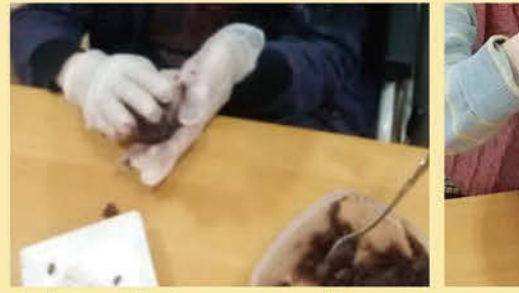
↑ 春のお彼岸にておはぎ作り