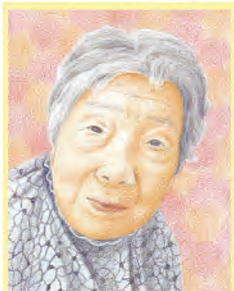
似顔絵作: 松田 郁美

Bさんは昭和2年、当別町で6人兄弟の末っ子として生まれます。家は農家で小さな時からお手伝いをしていて、「のこぎり釜で左手小指を切ってしまい今でも傷が残っている。消えなかつたわ」と見せてくれました。 春夏は家のお手伝い。冬は近所で和裁を習い、24歳の時農家の長男のご主人と結婚され、札幌東区でご主人の両親、兄弟と大勢での生活が始まります。1男3女と4人のお子さんに恵まれ子育てで忙しい毎日のなか、本家に嫁いだBさんは、お正月お盆と大勢の親戚が訪ねて来て大忙しで遊ぶ暇などまったくなかったそうです。