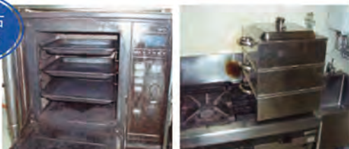
東雁来壱番館厨房