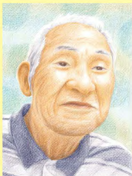
似顔絵作:松田 郁美

Sさんは昭和3年10月27日、新冠郡新冠町で11人兄弟(男6人、女5人)の3番目として生まれました。