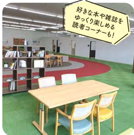
好きな本や雑誌をゆっくり楽しめる読者コーナーも!