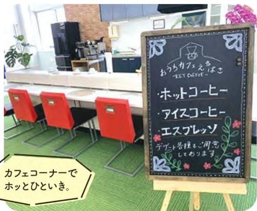
カフェコーナーでホットひといき。