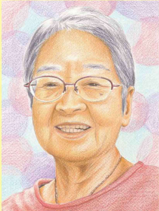
似顔絵作：松田 郁美

Ｔさんは昭和20年、小樽市にて4人姉妹のお生まれになりました。輝樂に転居するまでの60年間に小樽市末広町で過ごされます。お父様は日本銀行勤務、お母さまは専業主婦だったそう。手宮小学校時代のご記憶を教えてくださいました。 「学校行事以外に、父が近所や親せきの子供たちを10数名集め、主催した運動会が楽しかった。子煩悩だった父は子供たちをあちこちに連れて行ってくれた。手宮公園に桜を見に行った事などはいいいし出。」 中学校を経て、Ｔさんは桜陽高校へと進学します。特に思い出に残ったことを2つ。「同級生のグループで、試験勉強するために友達の家に集まるが多かった。勉強はあまりしなかったが、友達と過ごしたことは心に残っている。修学旅行は東京・京都。船酔いのせいで全体の京都見学ができなかったけれど、代わりにその時の彼と2人で京都を回ったことは忘