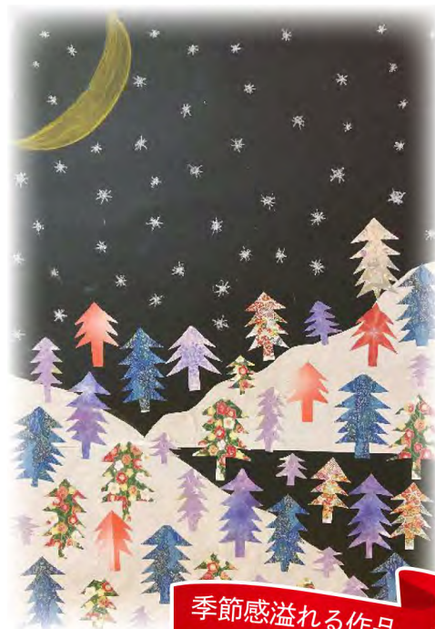
季節感溢れる作品

Sさんは、今年82歳になる方で、デイサービスセンター生きがいサロン東雁来に通われて2年目を迎えています。網走産まれで高校まで過ごし、卒業後は国鉄（旭川鉄道管理局）に入社。その後、転々と転勤されていて、一つ一つ丁寧な思い出しながら話してくださいました。 北見に転勤し22歳でお見合い結婚をされ、長女・次女をご出産され、ご出産後も働かれ、夫婦共働きをしていました。旭川に転勤しコンピューター室という場所で駅で働いている職員の給与計算をそろばんを使いコンピューターの数字との誤差がないか確かめる仕事と経理の仕事も携わっていたそうです。美瑛での転勤では駅勤務をされていたようで、「色々していた」とざっくりと話してくださいました。 最後は札幌に転勤し旅行センター（ホテル札幌弥生）で退職する60歳まで勤務され、その後は、5年間アルバイトとして国際観光旅館連盟で働いています。仕事で転勤も多く様々な仕事を任されたりと忙しかったと思えますが、話している雰囲気はいい経験が出来て楽しかったのだと感じました。 「稼ぎ先の義理の母に子ども達の面倒を見て頂き」ととてもお世話になった。「退職まで働くことができて感謝しています」と話してくださいました。