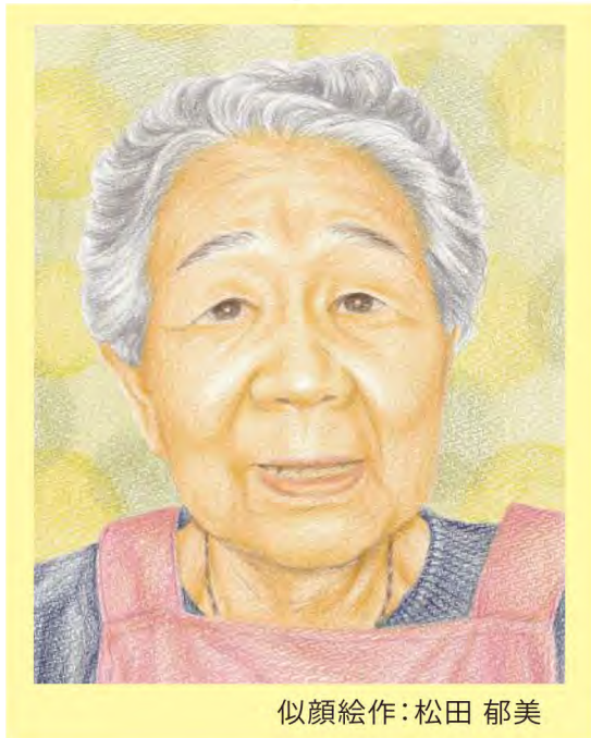
似顔絵作：松田 郁美

0さんは昭和6年8月に小樽市富岡町で5人兄弟の次女として生まれました。生まれも育ちも小樽市の生粋の小樽っ子です。ご両親は、お母様が専業主婦、お父様は港湾関係のお仕事をされていました。幼少期の思い出で印象に残っていることは、小学校に入学する際、帽子と靴、かばん、服が全部新品で嬉しくてたまらなかつたことと、春の進級や進学の時期に毎回お父様がお姉様と0さんを連れて靴屋さんに行き新品の革靴を買ってくれたことだそうです。