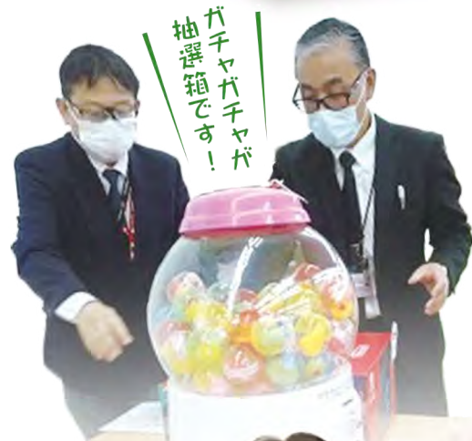
ガチャガチャガチャ 抽選箱です!

この2年間：おいらーく各事業所では、新型コロナウイルスの感染予防及び蔓延対策のため、会社の総力を挙げて取り組んできました！ なんと利用でも利用者さん・入居者さん、またそのご家族さま「第一」にももちろんご協力もたくさん賜りながら、必死で日々頑張ってきましたが、職員一人ひとり疲労困憊の状況でした。その中でたくさんの方々の職員との個別面談を実施する中で職員の笑顔や喜ぶ顔が見たいと、今回は職員対象の宝くじ大会を開催しました。その抽選風景を掲載させていただきます。(編集委員)