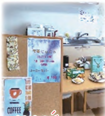
喫茶店に出かけた気分を味わってもらいました!

入居者様からもっと体を動かしたいとの要望がありました。そのため今月からせんりでは体操カードを作成し、体操に参加していただいた方にはスタンプを捺印しています。