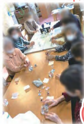
皆さん真剣に取り組んでおられました!