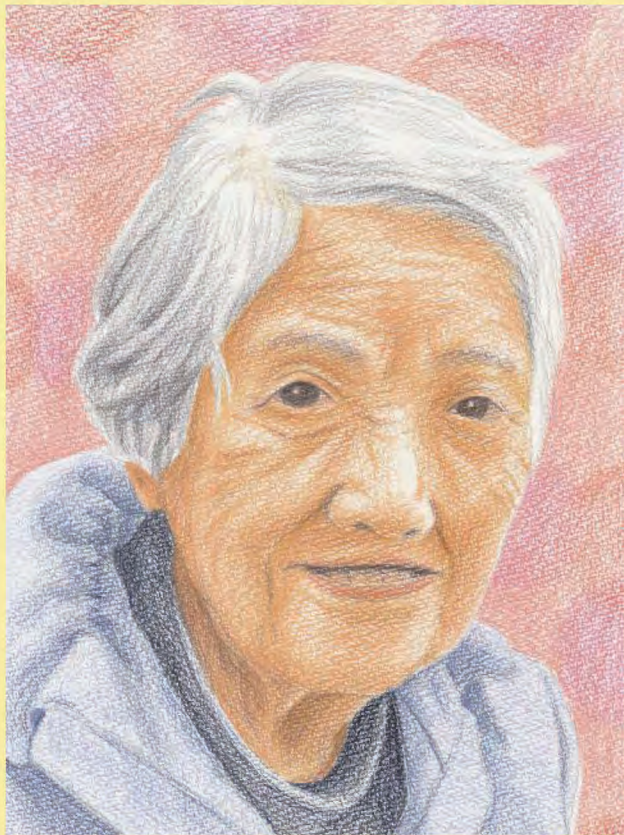
似顔絵作：松田 郁美