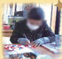
素敵なクリスマス装飾ができました！