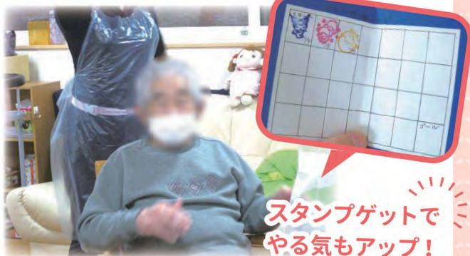
スタンプゲットでやる気もアップ!