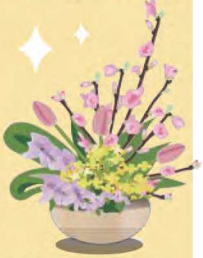
迫力ある素敵な生け花が玄関に登場！