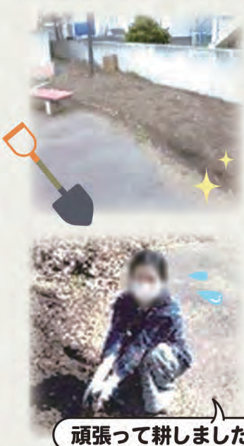
頑張つて耕しました！

耕した畑の雑草や石もテキパキと取り除き、土を触つて「ここの土は良い土です。ミャンマーの野菜も植えていいですか？」と。当たり前じゃないですか！どんどん植えてください！笑 今年はずり多く、また普段は見えない野菜にも出会えそうです♪(中島 絢子)