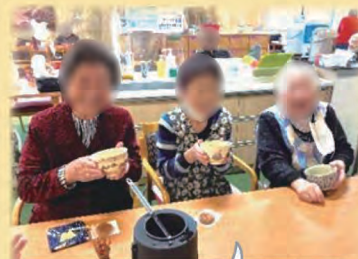
春といったらお茶会!