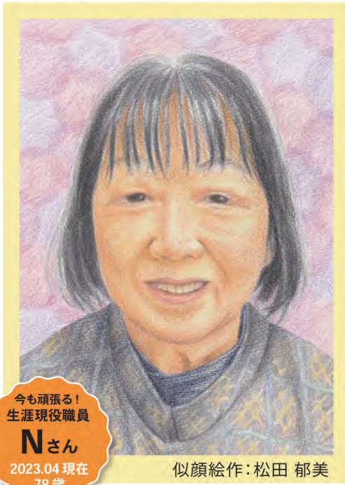
今も頑張る！ 生涯現役職員 Nさん 2023.04 現在 78歳