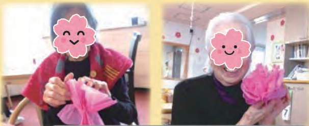
室内でも春が感じられる行事となりました！

今月の行事で、桜の花を咲かせようというタイトルで、入居者様には事前にお花紙でお花作りをして頂きました。行事当日は、事前に準備して置いた壁に描いた木に、ある程度のお花を貼り付けて置き、花見の雰囲気を感じてもらい、1つずつ花を付け足して満開にして頂きました。お花の帽子をかぶり写真撮影を行いました。お花をみんなで合唱し、職員手作りの創作スイーツを楽しんで頂きました。2階と3階に分けて行事を行った為、お花見の様子各階に違いはありましたが、それぞれに楽しそうな様子うかがえました。（うらら伏古DT委員会）