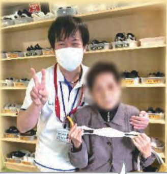
さっぱりキレイになりました！