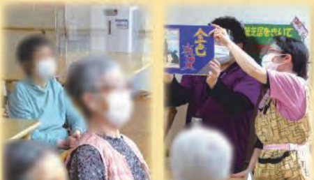
息がピッタリ！勝手に名演技で賞を。

職員達からは「突然、紙芝居を読む事になって焦った」との声もありましたが、十分に楽しんでる様子…（笑）。「和やかで暖かい春」のような雰囲気幕を閉じる事ができました。（東出）