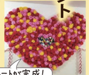
みんなの力で大きなハートが完成!

当日は、吉番館に来ていただいた方全員に、ミニチョコのプレゼントが配られ、老若男女すべての人が笑顔になって喜んでくださいました。「えー、チョコなんかもらったことない!」ご家族様も目を丸くして喜んでいただいた一日でした。（白鳥たか子）