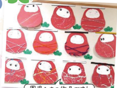
園児たちの作品です!