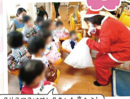
クリスマスはサンタさんも来たよ!