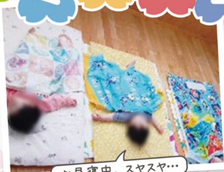
お昼寝中。スヤスヤ...