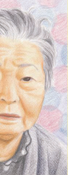
似顔絵作：松田 郁美

戦時中でも食べ物には困りませんでした。好き 嫌いはありませんでしたが、祖父が船乗りで次男 も市場で働いていたこともあり、毎日のように魚 を食べていました。家は海沿いにあり、海に入る とウニやアワビが山ほど獲れたそうです。兄があ まりにもたくさん魚を持って帰るため、兄のお 嫁さんが怒って魚を道路へ投げ出してしまふこと もあったとか。呉服店を営んでいた親戚や近所 の豆腐屋さんや魚を交換することもありました。 お正月になると兄は大きな大きなタラを背中 負って持ち帰り、近所へ配って歩いていました。